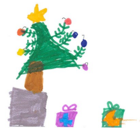
tekening uit het 1 e leerjaar